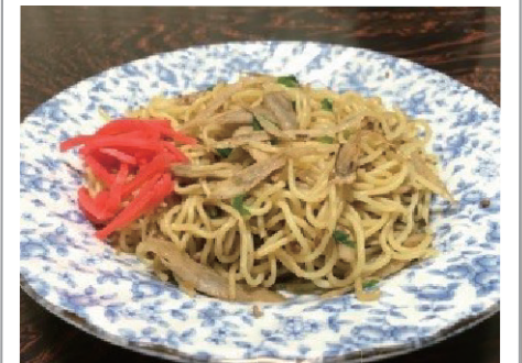
ごぼう入り焼きそば